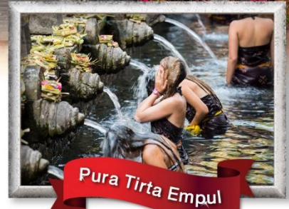
Pura Tirta Empul